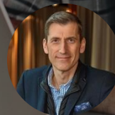
Friedrich W. Niemann Hospitality Industry GmbH